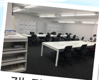
フリーアドレスデスク