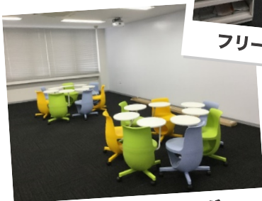
アクティブラーニング